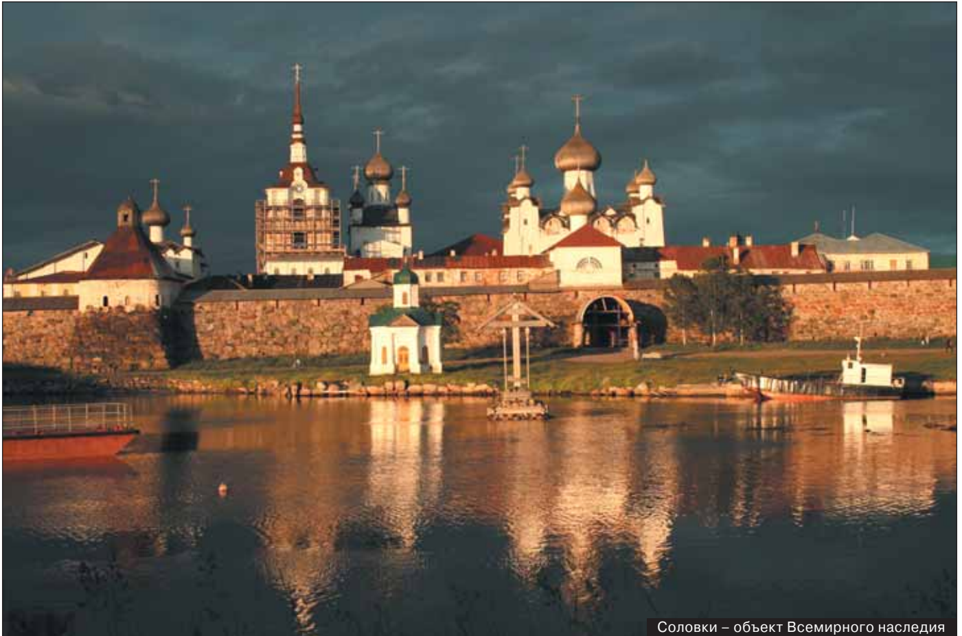
Соловки – объект Всемирного наследия