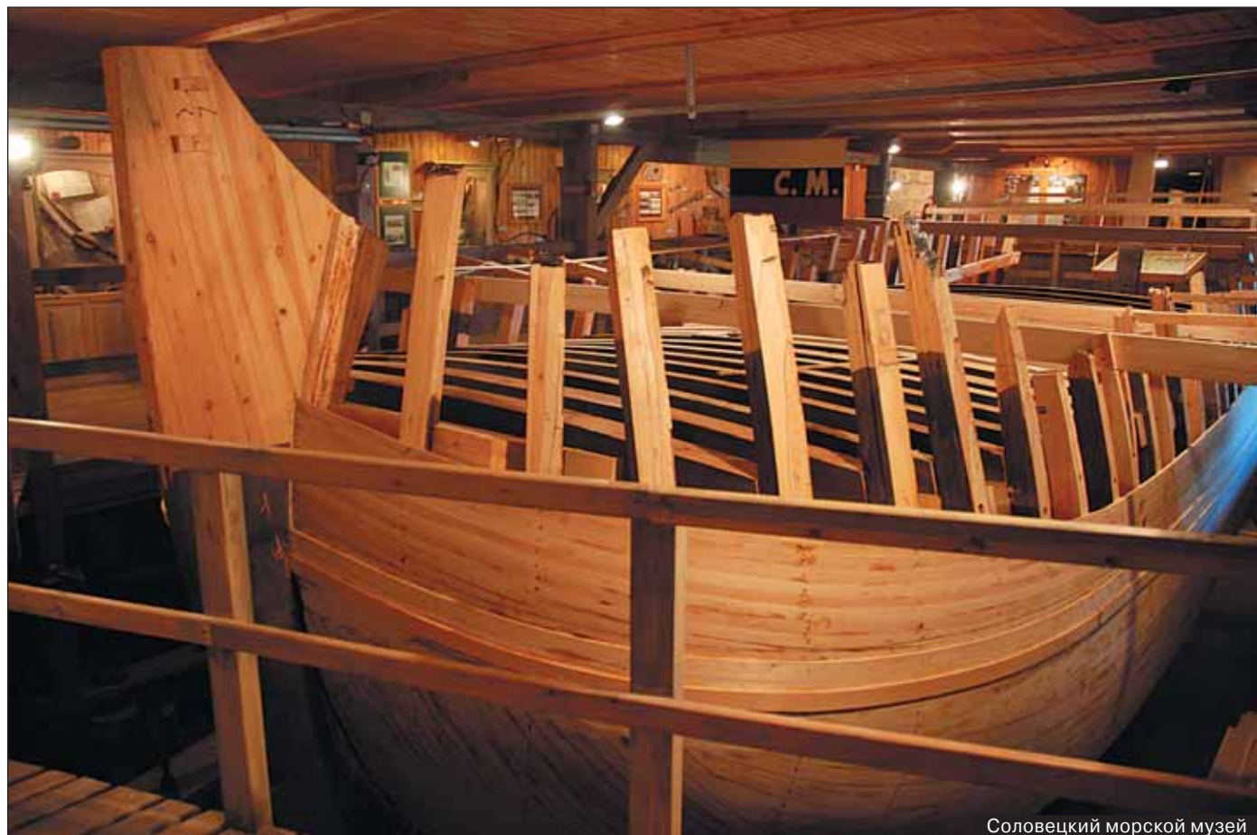
Соловецкий морской музей

рами приоритета государства в освоении Мирового океана, что особенно актуально для защиты национальных интересов Российской Федерации в Арктическом регионе. Объекты морского наследия в международном масштабе – это элементы и символы российского присутствия в акваториях морей и на прибрежных территориях и свидетельства успешной морской политики государства.