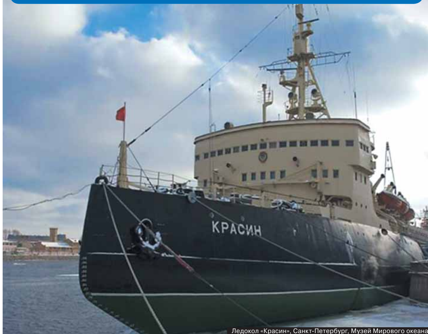
Ледокол «Красин», Санкт-Петербург, Музей Мирового океана