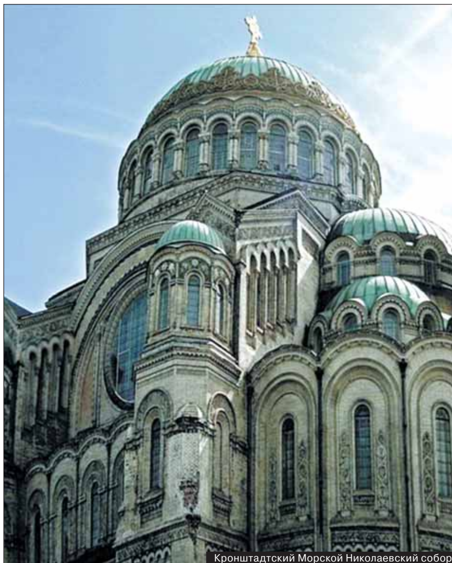
Кронштадтский Морской Николаевский собор